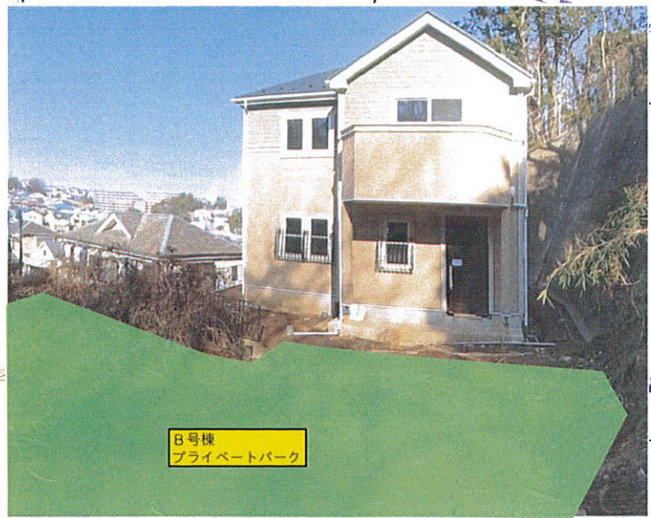
B号棟 プライベートパーク